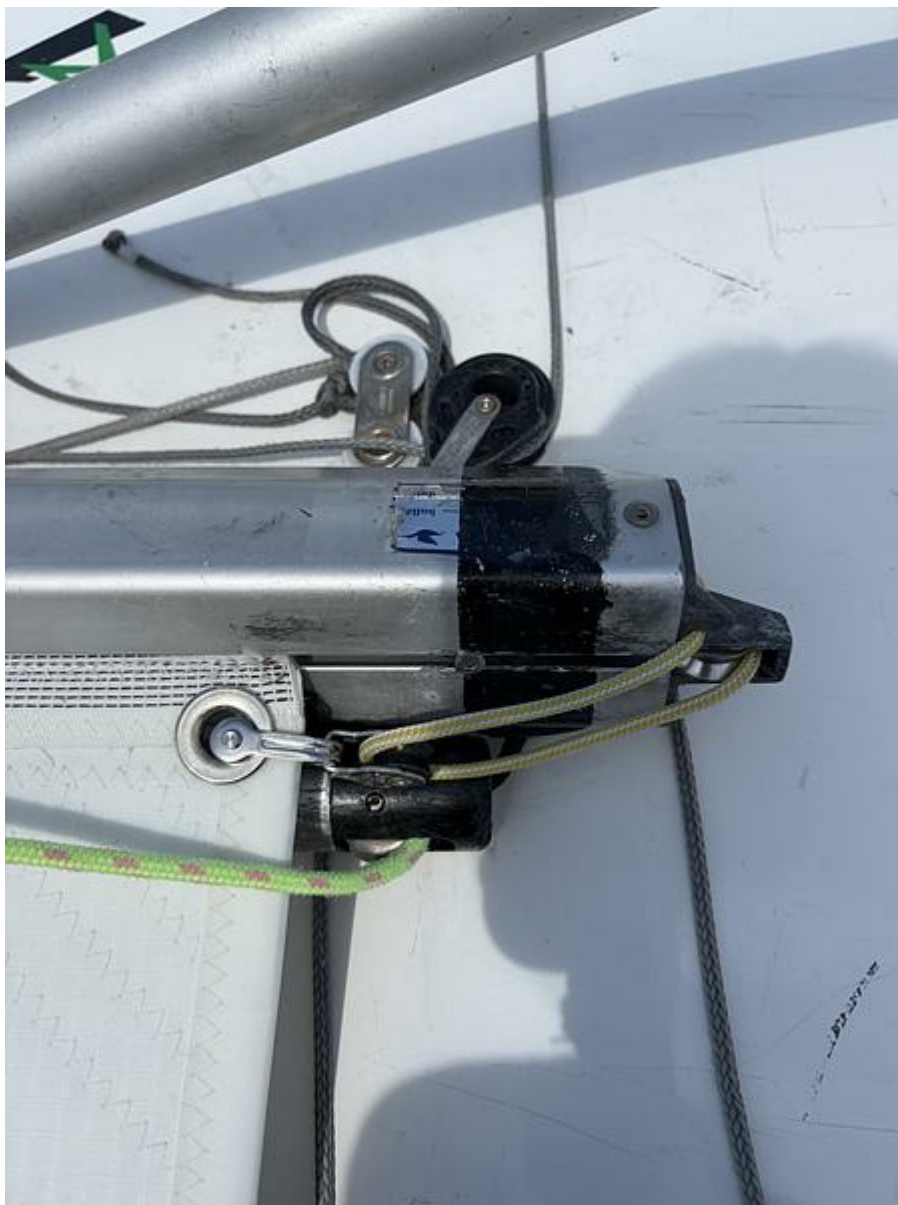
IMG_1909.jpeg 3.46 MB