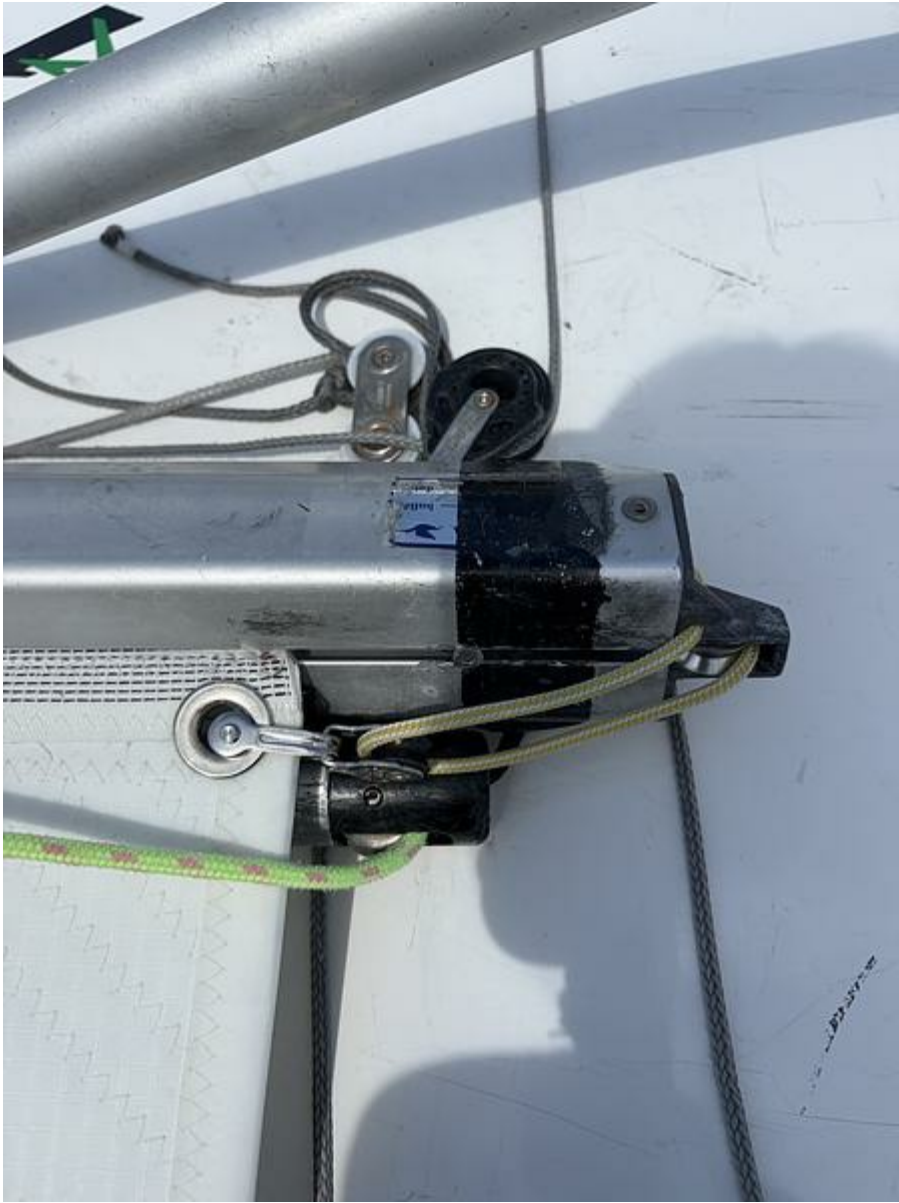
IMG_4669.jpeg 631 KB