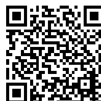
Richieste di inserimento in classifica